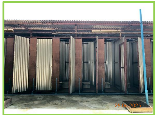
ห้องส้วมภายในบ้านพักคนงาน