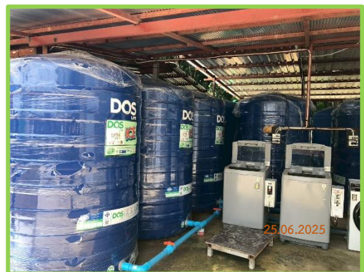
ถังสำรองน้ำใช้ภายในบ้านพักคนงาน