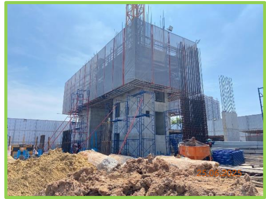
พื้นที่ก่อสร้างโครงการ