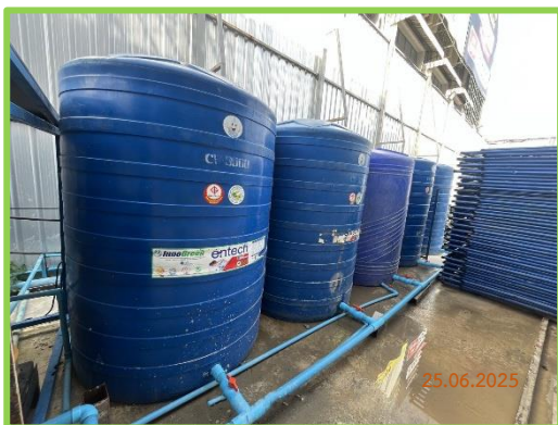
ถังสำรองน้ำใช้ในโครงการ