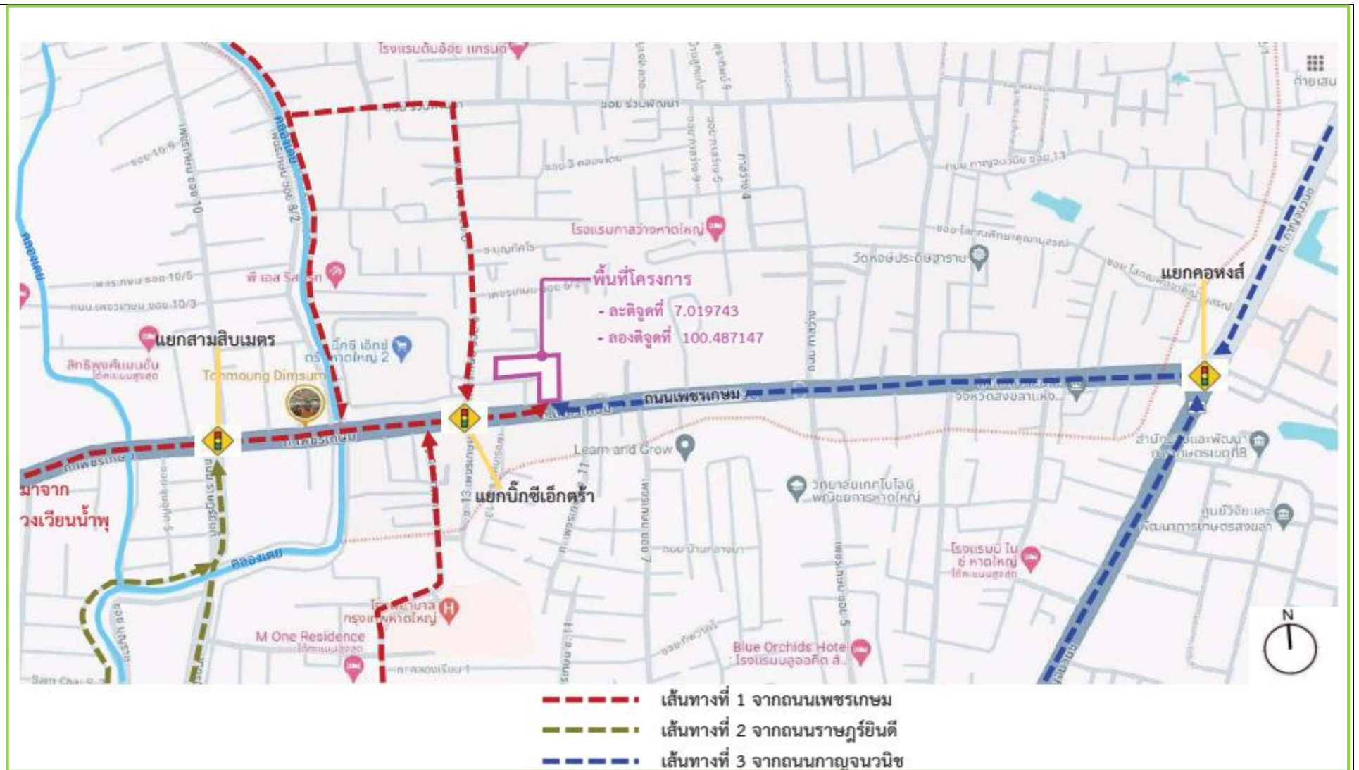
รูปที่ 1-1 แผนที่แสดงที่ตั้งโครงการ