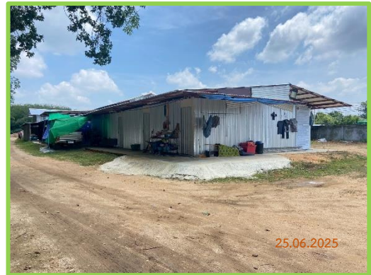
บ้านพักคนงาน