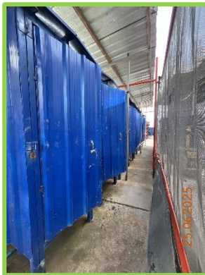
ห้องส้วมภายในภายในโครงการ